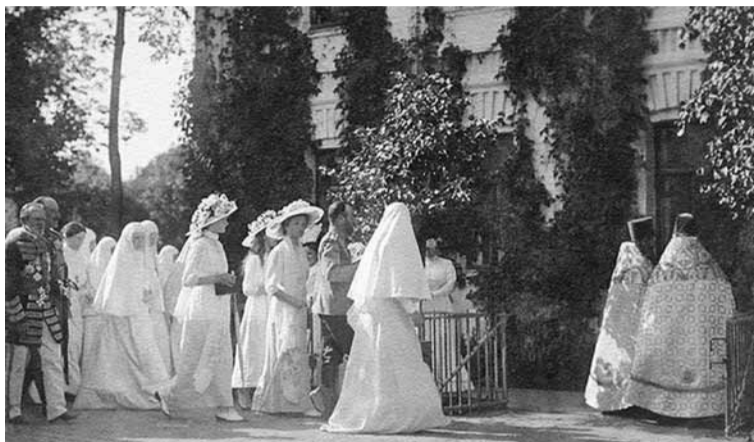
→ Государь Николай II с дочерьми осматривает Обитель. Май 1912 г.

С января 1911 года Нестеров начал писать самую большую пятнадцатипятнадцатую картину «Путь ко Христу», которая должна была восполнить то, что не удалось выразить в «Святой Руси». Первый вариант из-за сырости стен пришлось счищать с них. Совместно с Великой княгиней решено было переписать её на медной доске, а под остальные картины подготовить стены по способу Кейма. Работы было очень много: присмотр за грунтовкой стен в храме обители, выполнение орнамента на стенах в виде деревьев, цветов, растений. Однажды по указанию Ели-