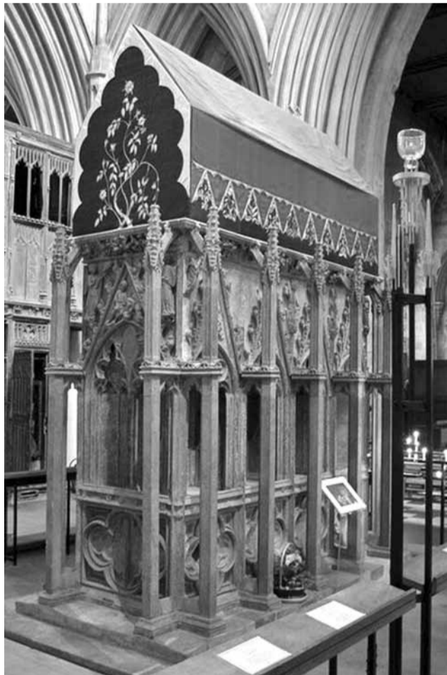
Гробница Святого мученика Албана

Скорее до правителя области дошел слух, что христианский священник нашел приют в доме Албана. Разгневавшись, он велел привести к себе служителя