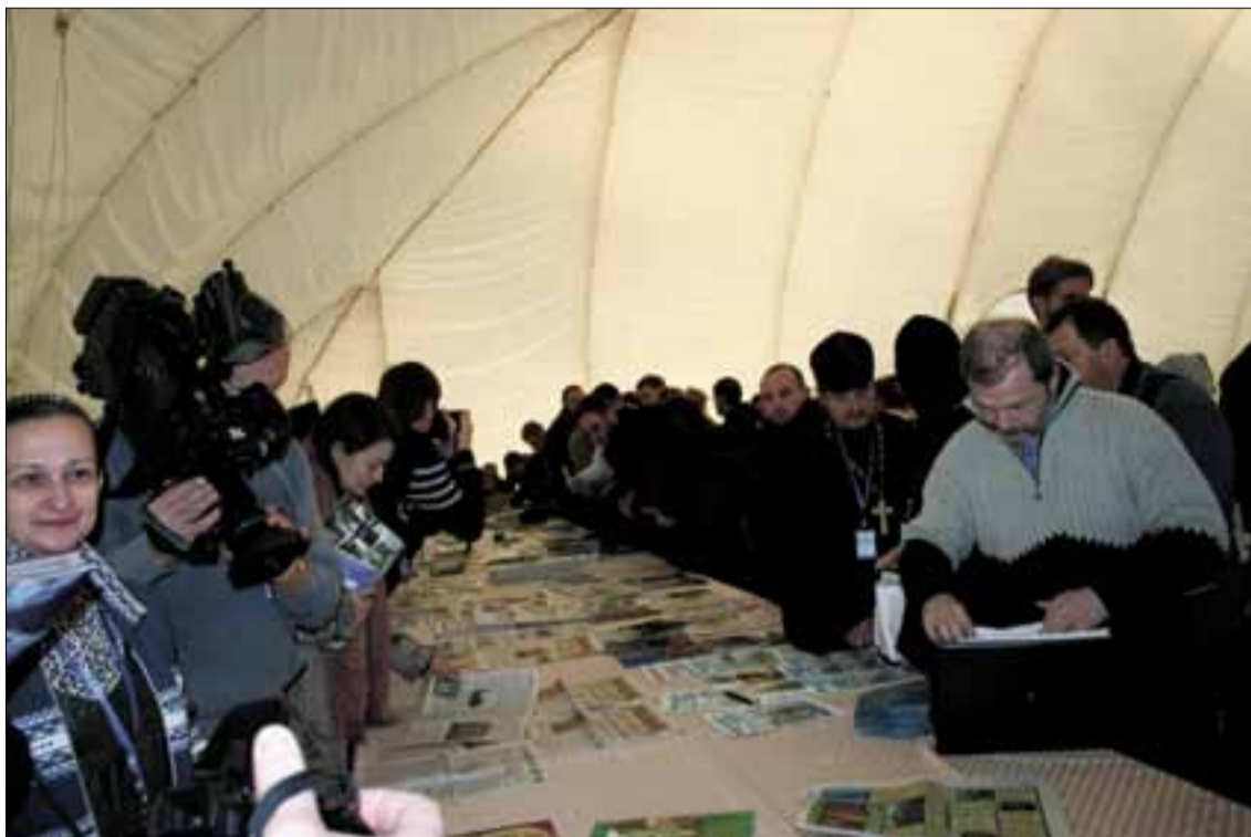
→ Выставка епархиальных газет и журналов