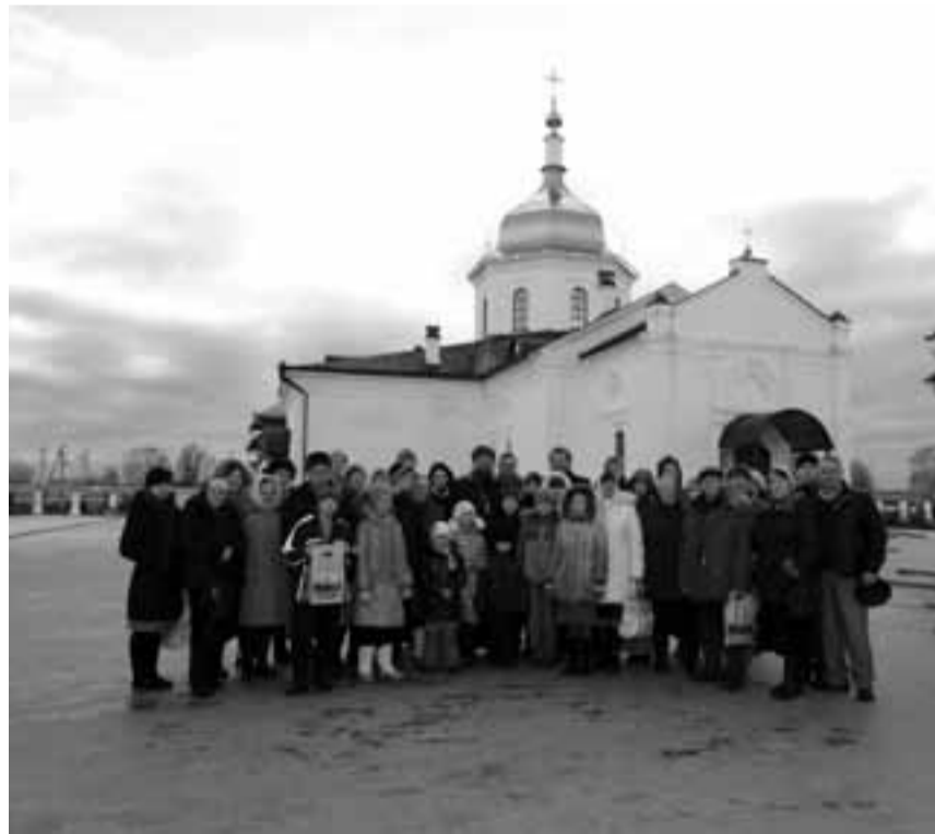
→ Свято-Знаменский Абалакский мужской монастырь. В гостинице при этом монастыре мы жили 4 дня.

приехали к Литургии, которая была особенно торжественной, так как в этот день не было электричества. Молитесь при свечах, как первые христиане. При свечах была и трапеза после службы. Затем съездили на святой ис-