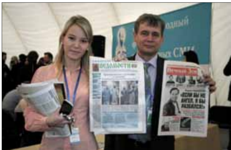
→ С редактором газеты «Вечный зов», г. Санкт-Петербург

для нас события. Мы не пожалели, что прилетели в регистрационный день. Сначала участников было немного, но к концу второго дня набралось около 500.