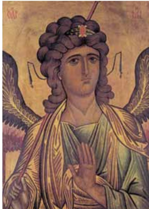
Архангел Михаил, Византия, Синай, XII в. Хранится в алтаре базилики

Это и наш путь на земле: мы должны умалиться, постепенно терять то, что кажется таким драгоценным, а на самом деле есть сущность нашего видимого естества. Мы должны постепенно делаться прозрачными, чтобы стать как бы невидимыми — как драгоценный камень невидим и обнаруживается только тем светом, который, ударяя в него, осияет все вокруг. Тогда мы как будто теряем что-то из своего временного существа, но для того только,