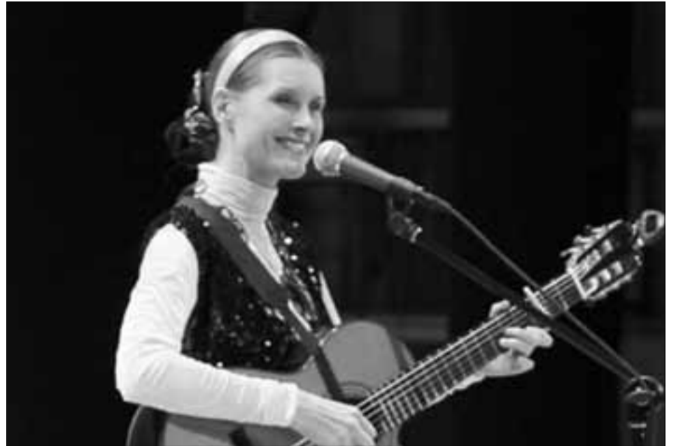
→ На концерте в ДК «Юбилейный»

- Я просто собираюсь и выхожу. Выхожу общаться с людьми, с моими дорогими зрителями, которые пришли послушать