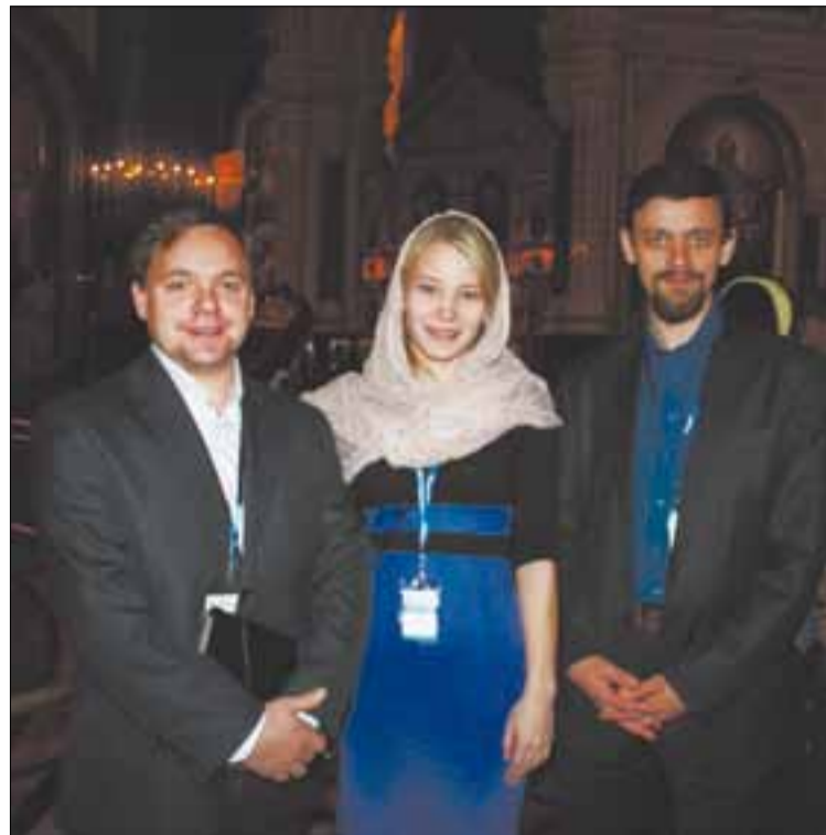
→ В Храме Христа Спасителя