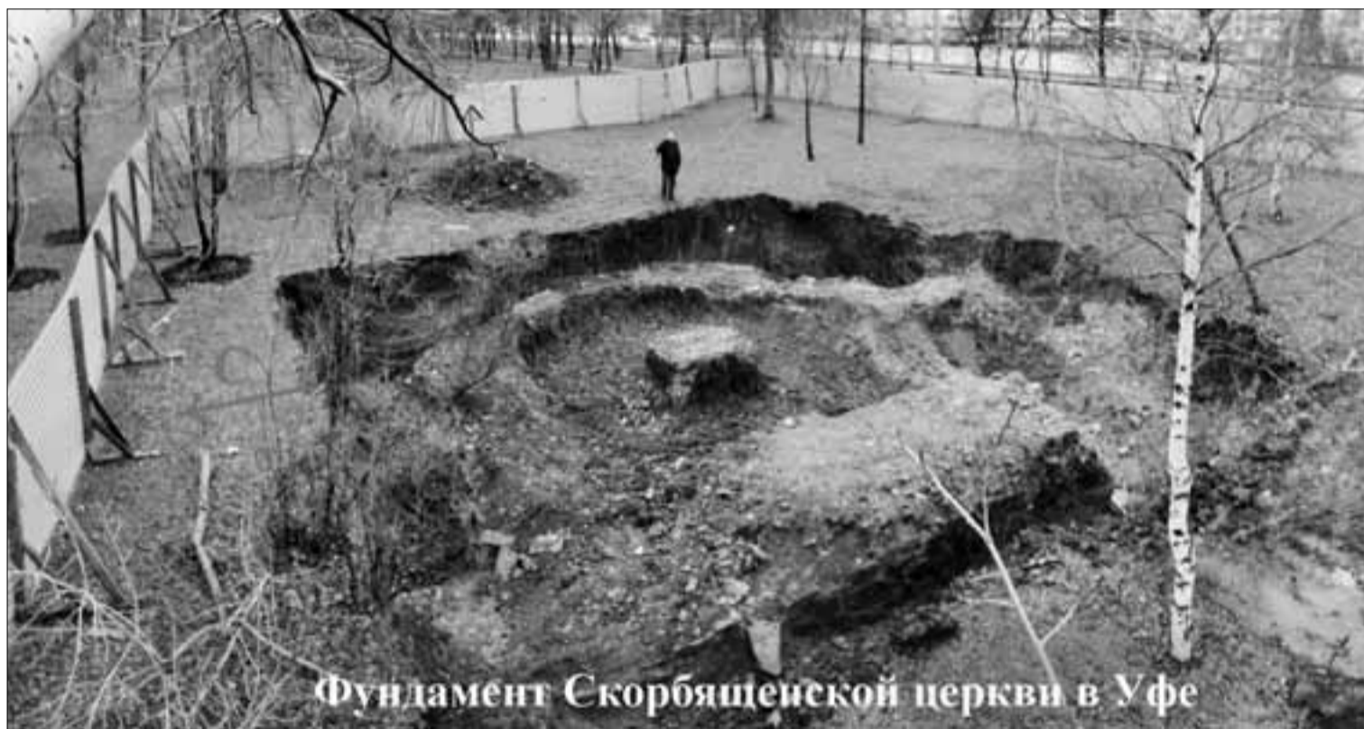
Фундамент Скорбященской церкви в Уфе