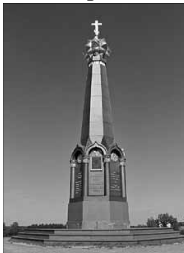
Главный монумент русским воинам у батареи Раевского, у подножия которого похоронен П. И. Багратион

И ещё раз хочу подчеркнуть простую мысль: только тогда, когда народы России объединялись, были вместе, они добивались самых больших результатов в развитии своего Отечества. По большому счёту, в единстве народа России и заключается патриотизм, который во все времена был главной основой всех великих наших по-