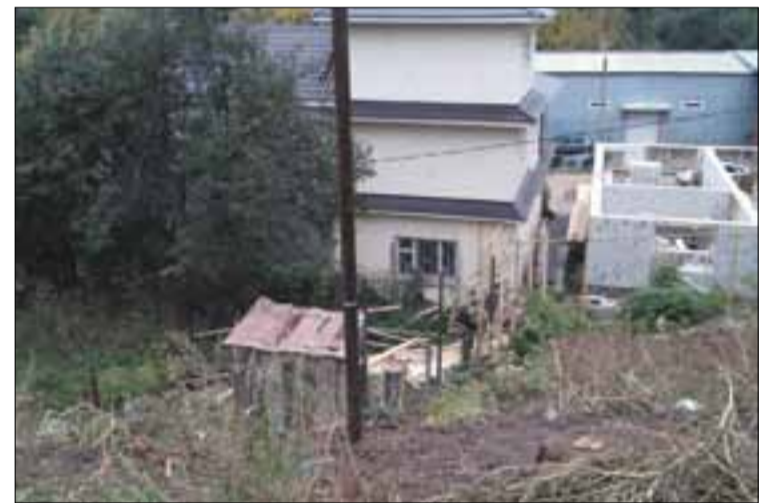
→ Строительство объекта на территории Спасского храма