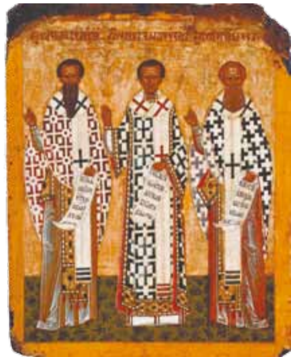
→ Святители Василий Великий, Григорий Богослов, Иоанн Златоуст

Проблема отношения веры и разума — одна из ключевых в христианской философии и богословии. Особенно остро эта проблема стоит в православной апологетике и миссионерстве: имеем ли мы право вторгаться силами нашего разума в вопросы религии — рассуждать о Боге, о чуде, о Таинствах и так далее. Можем ли мы судить разумно или должны оставаться только на позиции веры? Следовательно, если мы скажем, что христианство должно опираться на разум, то скажут, что мы тем самым поставим веру под начало знания, а «все, что не по вере, грех» (Рим. 14, 23). А если мы в своей проповеди Евангелия будем говорить, что надо просто верить в Иисуса Христа, то очевидно возражение: «Почему именно во Христа? Должен быть критерий выбора. Поверить просто так — это легкомыслие». И возражающий будет по-своему прав: нельзя верить «просто так», должно быть некое основание. Но, с другой стороны, вера всегда предполагает акт волевой, свободный, ибо в объекте веры всегда можно сомневаться. Ведь в том-то и заключается подвиг веры, что человек преодолевает в себе это сомнение,