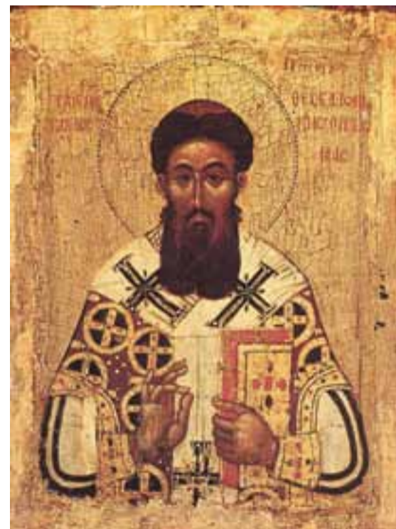
↪ Св. Григорий Палама

Понятно, почему в таком случае возникает кажущееся противоречие между разумом и волей, с одной стороны, и верой — с другой: я, скажем, хочу заставить себя поверить, но не могу доказать. Или наоборот: доказываю, но не могу себя заставить поверить. Дело в том, что вера принадлежит к иной, чем разум и воля, реальности; вера объединяет их, даёт им существование и способность действовать, является их основой и средой их существования. Именно поэтому противоречия между верой и разумом не может существовать в принципе, поскольку они — явления разных порядков. Противоречие возникает лишь тогда, когда вера отождествляется только с волей и в разделённой душе появляется некая несогласованность её начал. Если же понимать веру онтологически и богословски, а не только личностно-психологически, то очевидно, что отношения между разумом и верой более глубокие: с одной стороны, разум, как свойство души, может приводить человека к вере, но с другой — насильственно сделать это (доказать существование объекта веры так, как доказывается математическая теорема) не может, ибо разум — это ещё не вся душа. Так же выстраиваются и отношения свободной воли с верой: поскольку вера включает в себя волю, то вера всегда свободна, но поскольку вера не сводится только к воле, нельзя поверить во всё что угодно. Можно сказать, таким образом, что вера — это свободное умозрение истины, осуществляющееся целостным человеком по благодати Божией. Именно такую веру имеет в виду