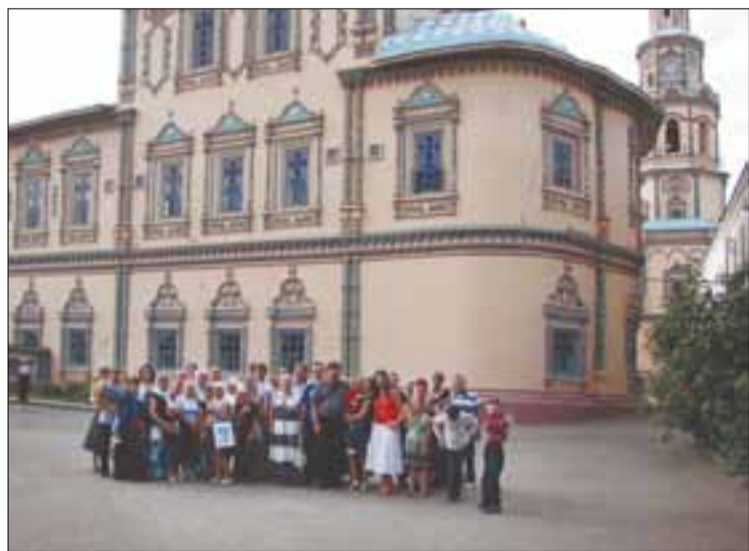
→ Казань, Собор Петра и Павла, где мы приложились к чудотворным образам Смоленской Семиезерной иконе Божией Матери, чудотворной иконе Богородицы Феодоровской, чудотворной иконе Святителя Николая, к мощам святых Ионы и Нектария Казанских и Святителя Ефрема