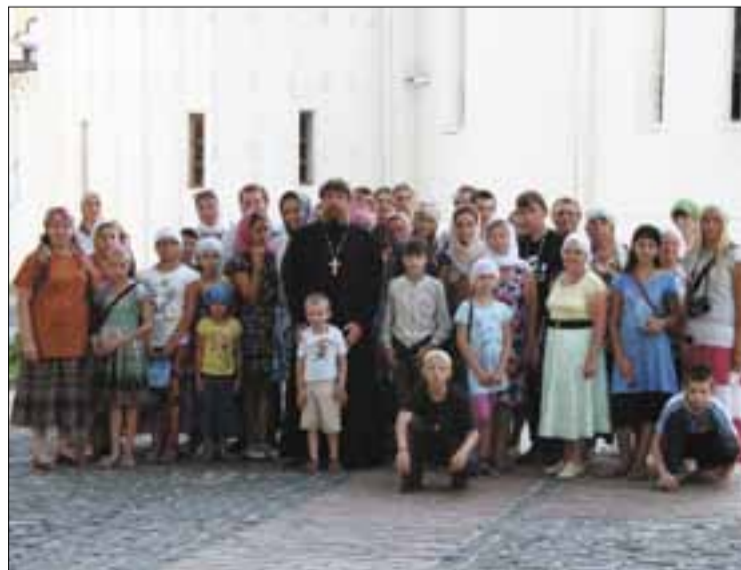
→ Вся группа в полном составе. Собираемся в Суздальский кремль.

Прихожане Богородице-Владимирского прихода с. Юматово.