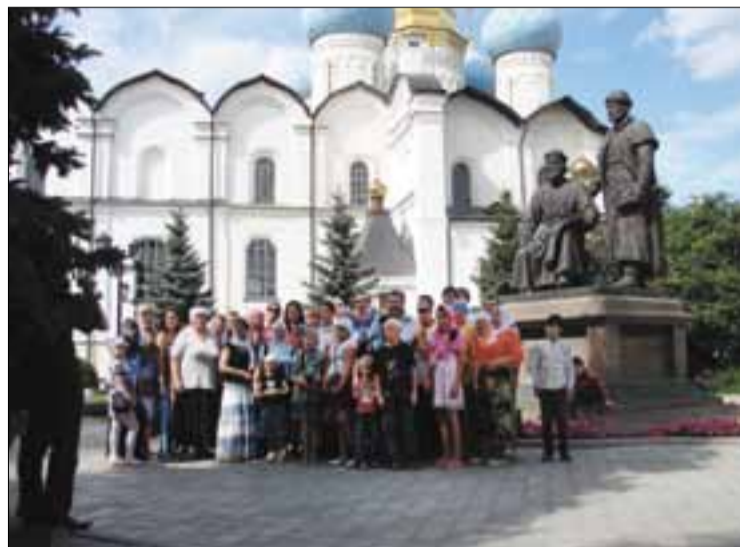
→ Благовещенский собор на территории Казанского кремля. Наша паломническая группа на фоне памятника архитектору собора

Вечером того же дня мы приехали во Владимир и вошли в знаменитый владимирский Успенский собор — успели на вечернюю службу! Здесь мы приложились к мощам святого князя Андрея Боголюбского, увидели своими глазами и