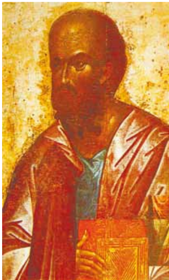
→ Апостол Павел

Чаще всего под верой понимается свободное согласие с каким-либо положением, которое невозможно доказать. Такую веру апостол Павел назвал «верой от слы-