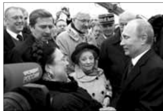
На торжествах, посвященных 200-летию победы в Отечественной войне 1812 года, Президент России Владимир Путин встретился с почетной гостьей праздника Государыней Великой Княгиней Марией Владимировной.

После Богослужения Глава Российского Императорского Дома возложила на митрополита Илариона знаки Императорского Ордена Святой Анны I степени. Митрополит Иларион поблагодарил Государыню, отметив, что еще в те далекие времена, когда на российской земле господствовал атеизм, он глубоко почитал Царственных Страстотерпцев. «В ту пору никто не мог предвидеть, что когда-нибудь они будут причислены к лику святых и будут общенародно почитаться. Я рад тому, что восстановлена связь времен, что сегодня члены Царской Семьи являются нашими предстателями перед Престолом Господним, — сказал он. — Я очень рад приветствовать Вас как Главу Российского Императорского Дома в нашем храме в честь иконы Божией Матери «Всех скорбящих Радость». И, благодаря за высокую награду, хочу пожелать помощи Божией в Вашем