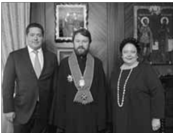
Государыня Мария Владимировна, Наследник Российского престола Великий Князь Георгий Михайлович и митрополит Волоколамский Иларион в день вручения владыке Илариону Оргена Святой Анны I степени. 3 сентября 2012 г.

Завершив церемонию, Владимир Владимирович Путин подошел к почетным гостям.