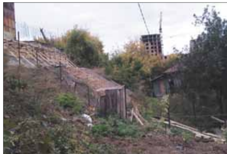
→ Восстанавливаемая алтарная часть храма

- Рядом находится магазин, от этого магазина и идёт строительство. Конкретное лицо пока нам неизвестно, однако от имени одной женщины уже был иск, что она является, якобы, собственницей части строения.