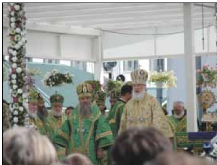
→ День памяти преподобного Серафима Саровского. Праздничную Божественную литургию в Дивеево служит Патриарх Московский и всея Руси Кирилл

на озере Лебяжьем. После такого насыщенного путешествия всем нужен отдых: купание, катание на лошадях,