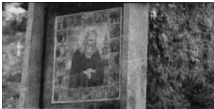
→ Иконы святого Германа Аляскинского висят на деревьях вокруг часовни

Петерсон. — Я думаю, что многие люди чувствуют себя связанными с ним, ибо он жил не так давно».