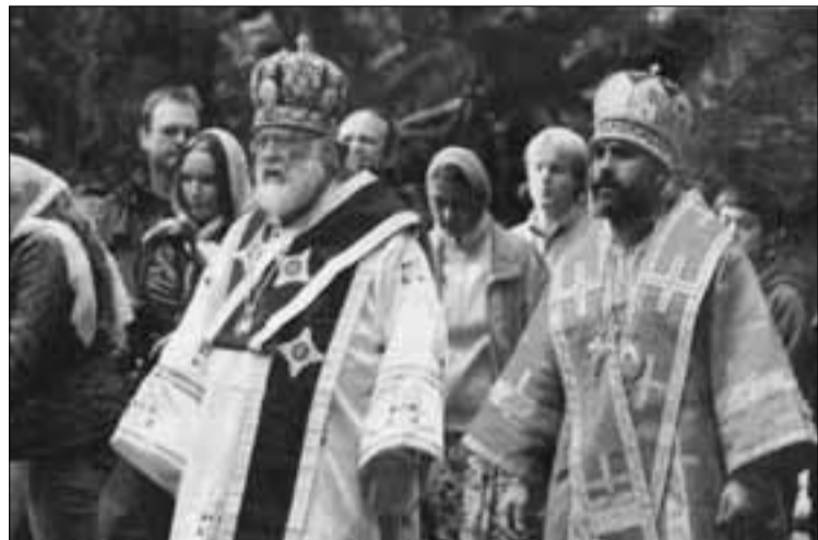
→ Архиепископ Сан-Францисский и Западно-Американский Вениамин Петерсон, благочинный Аляскинской епархии, и епископ Салаватский и Кумертауский Николай

Во время ежегодного паломничества 8 августа верующие собрались в часовне в честь святых Сергия и Германа Аляскинских, чтобы отпраздновать день памяти преподобного Германа. Каждый год паломники со всего мира посещают храм на острове Спрус на Аляске, чтобы поклониться православному святому, который был канонизирован 42 года назад. В этом году архиепископу Сан-Францисскому и Западно-Американскому Вениамину на Божественной литургии сослужил епископ Салаватский и Кумертауский Николай.