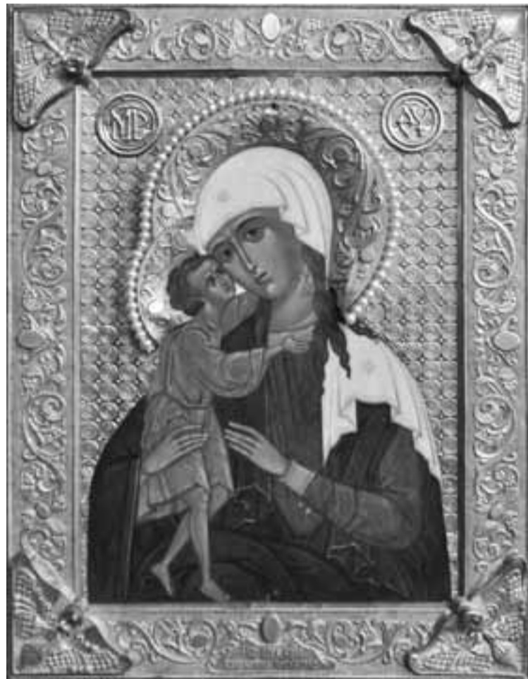
→ Взыскание погибших

Далее автор приводит «малопонятные» слова, которые предлагается заменить: «от лести идольския > от прельщения идольского; напрасно судия приидет > внезапно судия приидет; во всем угодзिति > во всем