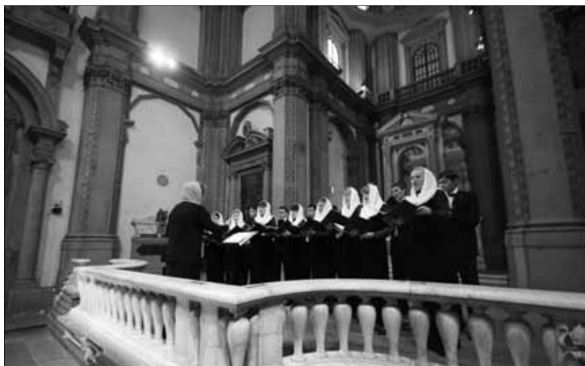
Концертное выступление. Италия