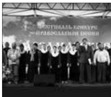
Выступление в Арзамасе

С 28 июля по 1 августа в Арзамасе прошёл третий фестиваль-конкурс православной и патриотической песни, в котором хор Кирилло-Мефодиевского храма стал лауреатом II степени.