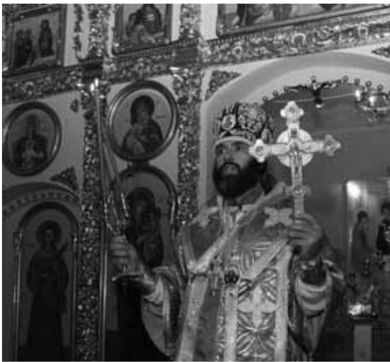
Литургия в Богородице-Скорбященском храме села Соколовки