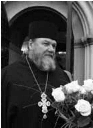
Во имя Отца и Сына и Святаго Духа!

Радуйся, нечаянную радость верным дарующая! (из акафиста «Нечаянной радости»)