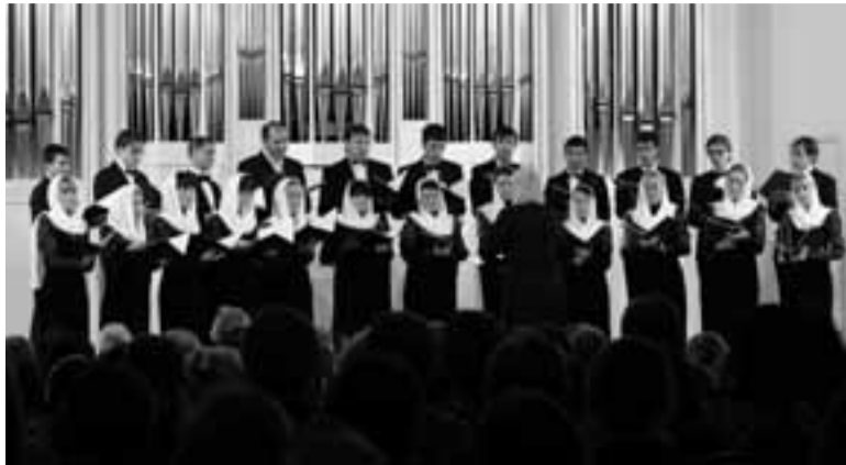
Хор Кирилло-Мефодиевского храма г.Уфы.

21 ноября в день Архистратига Михаила в республиканской филармонии состоялся концерт духовной хоровой музыки.