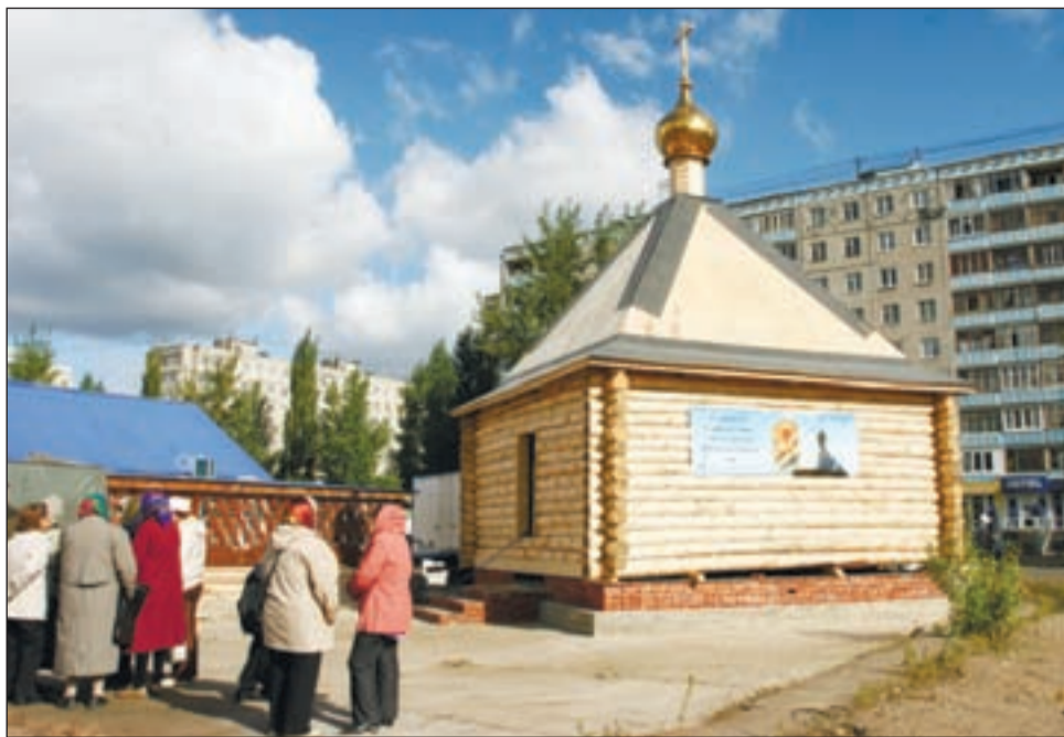
→ Храм во имя Блаженной Матроны Московской.