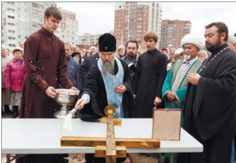
→ Владыка Никон освящает крест.