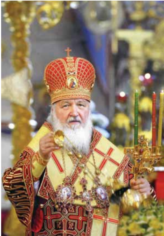
Возлюбленные о Господе Преосвященные архипастыри, всечестные пресвитеры и диаконы, боголюбивые иноки и инокини, дорогие братья и сестры!

«Явилась благодать Божия, спасительная для всех человеков» (Тит. 2, 11)